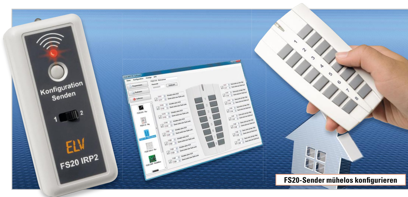
FS20-Sender mühelos konfigurieren