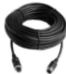
2x20m Stromversorgung (Kamera)